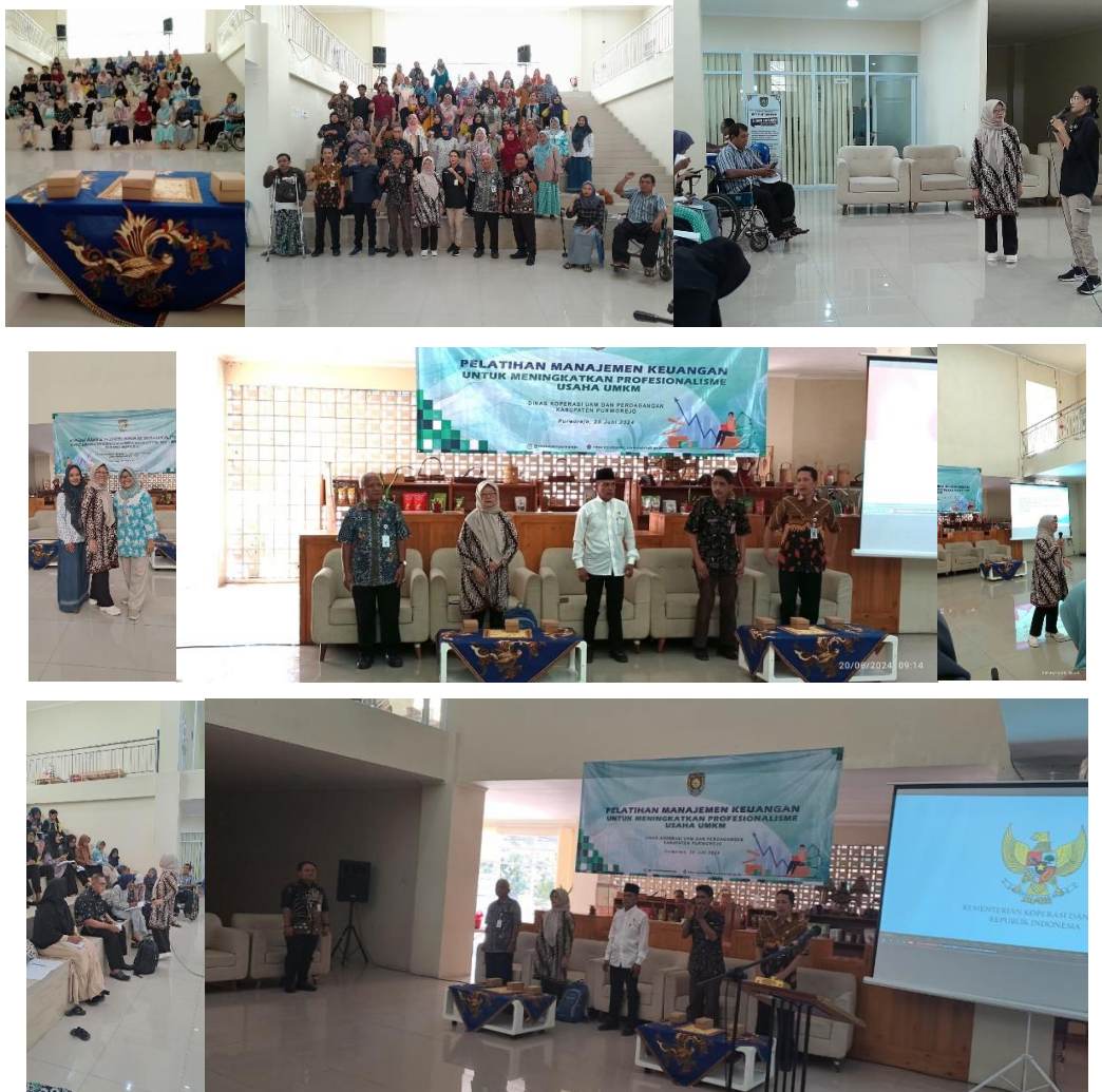
Gambar 3.1 Foto-Foto Kegiatan Pelatihan

Menggambarkan suasana pelatihan, pengajaran, pembinaan dan pemberdayaan masyarakat pelaku UMKM yang dinamis. Dari narasumber diceritakan bahwa peserta sangat antusias mengikuti pelatihan, karena banyak hal-hal baru yang selama ini tidak mereka ketahui.