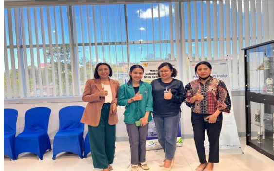
Gambar 1. Foto Bersama Peserta dan Pegawai Bank BRI Kantor Cabang Soe

Dosen Pendamping Magang. Evaluasi penilaian bukan hanya dari Dosen Pendamping Magang tetapi juga dari Pendamping Lapangan dari Bank BRI Kantor Cabang Soe dimana Pendamping Lapangan mengevaluasi pekerjaan pemegang selama bekerja dengan mereka di kantor tersebut.