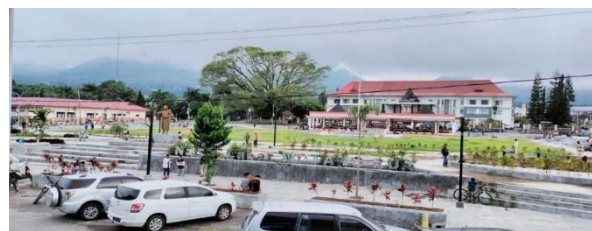
Lapangan Motang Rua "Natas Labar"