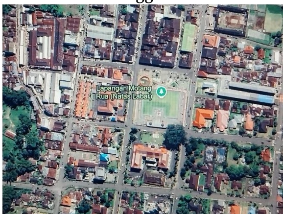
Gambar 1.1 Lapangan Motang Rua Kabupaten Manggarai