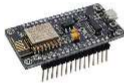
Gambar 2. NodeMCU ESP8266

NodeMCU ESP8266 adalah mikrokontroler yang dilengkapi dengan modul Wi-Fi , memungkinkan koneksi langsung ke jaringan internet tanpa memerlukan perangkat tambahan. Mikrokontroler ini banyak digunakan pada proyek berbasis IoT karena memiliki kemampuan pemrosesan data yang cepat serta mendukung berbagai bahasa pemrograman seperti Arduino IDE . Selain itu, NodeMCU ESP8266 memiliki keunggulan berupa kemudahan integrasi dengan sensor-sensor eksternal dan layanan cloud , sehingga dapat digunakan untuk sistem otomatisasi maupun pemantauan jarak jauh (Fauzi and Setiawan, 2024). Dalam penelitian ini, NodeMCU ESP8266 berfungsi sebagai pengendali utama yang menerima input dari sensor SW-420 , memproses data getaran, dan mengirimkan hasilnya ke aplikasi Blynk serta Telegram .