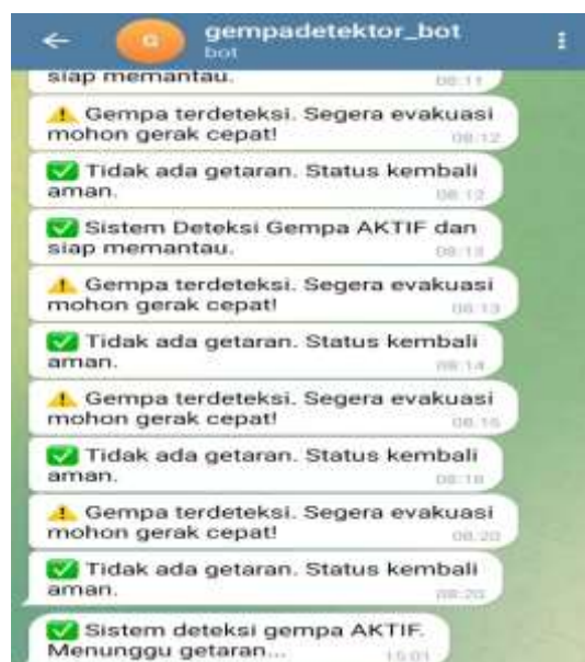
Gambar 6. Notifikasi pada Aplikasi Telegram

Gambar diatas menunjukkan notifikasi yang otomatis muncul pada Platform Blynk yang digunakan untuk menghubungkan Perangkat keras ( hardware ) Miktokontroler, Sensor dengan aplikasi Smartphone dan web secara real time . Notifikasi ini muncul ketika Sensor SW-420 mendeteksi adanya Geratan. Setelah itu maka data getaran yang ada pada sensor akan otomatis masuk ke mikrokontroler dan mikrokontroler akan otomatis memberi instruksi berupa notifikasi yang otomatis terkirim ke Platform Blynk.