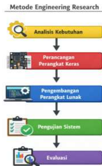
Gambar 3. Metode Engineering Research

Penelitian ini menggunakan metode rekayasa ( engineering research ) dengan pendekatan deskriptif eksperimental , di mana fokus utama adalah merancang dan menguji sistem deteksi getaran gempa berbasis Internet of Things (IoT) . Tahapan penelitian meliputi perancangan sistem, implementasi, serta pengujian fungsi perangkat keras dan perangkat lunak untuk memastikan sistem bekerja sesuai dengan rancangan (Abdalzaher et al. , 2023).