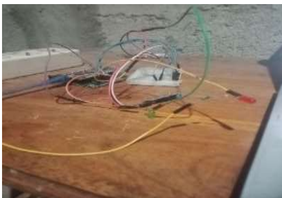
Gambar 4. Rangkaian Sistem

Ketika sensor mendeteksi getaran melebihi ambang batas yang telah ditentukan, NodeMCU ESP8266 akan memproses sinyal tersebut dan mengirimkan notifikasi otomatis ke aplikasi Telegram melalui Telegram Bot API . Pada saat yang sama, status sistem diperbarui secara real-time di dashboard Blynk . Gambar 1 menunjukkan hasil perancangan perangkat keras sistem deteksi getaran berbasis IoT, sedangkan Gambar 2 dan 3 menampilkan hasil notifikasi aplikasi Blynk dan pesan notifikasi di Telegram .