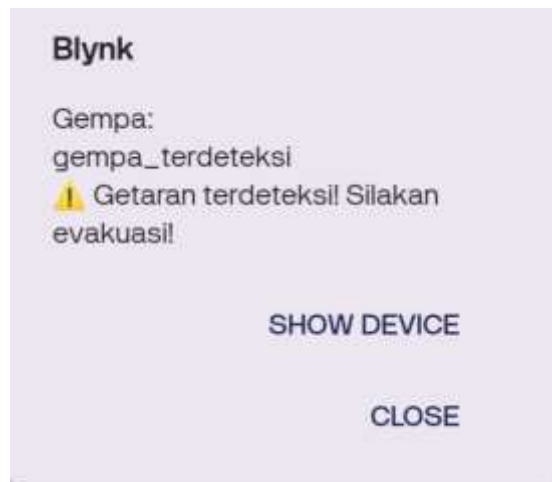
Gambar 5. Notifikasi pada Aplikasi Blynk

dan juga papan Breadboard untuk merakit, menguji tanpa perlu menyolder. Semua perangkat yang sudah terhubung nantinya akan berkerja sesuai dengan logika kode program yang dimasukan pada code editor sehingga penerapan atau implementasi peringatan dini gempa berbasis IoT bisa terealisasi.