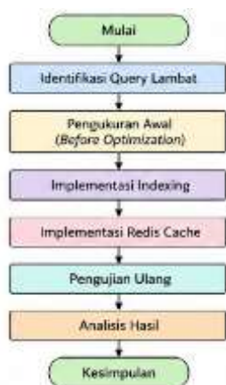
Gambar 1. Tahapan Penelitian

Gambar 1 menunjukkan tahapan penelitian yang dilakukan untuk mengevaluasi pengaruh teknik indexing dan caching terhadap kinerja database. Penelitian diawali dengan proses identifikasi query lambat, yaitu menentukan query yang memiliki waktu eksekusi tinggi dan sering digunakan pada sistem. Identifikasi query lambat merupakan langkah penting dalam optimasi basis data karena memungkinkan pengembang menemukan bottleneck yang menyebabkan penurunan performa sistem (Budiman et al., 2025).