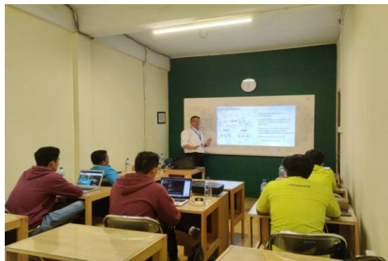
Gambar 2. Pembahasan Materi Network+

Pada setiap sesi dilakukan sharing session pengalaman nyata pemateri pada kasus-kasus terkait dilapangan dan kemudian dilakukan sesi tanya jawab, selanjutnya pada hari terakhir training dilakukan exam sertifikasi network+. Selanjutnya, pada akhir kegiatan tranining dilakukan review materi yang telah disampaikan dan dipraktikkan untuk memastikan pemahaman seluruh peserta sudah sesuai dengan targer materi. Setelah kegiatan training selesai, dilakukan uji kompetensi sertifikasi profesi dari CompTia+ dengan skema Network+, dalam ujian tersebut peserta akan diberikan pertanyaan konseptual dan praktikal untuk menguji pengetahuan peserta, setelah peserta dinyatakan lulus dengan nilai minimal yang harus dicapai maka peserta akan diberikan sertifikat yang berlaku internasional.