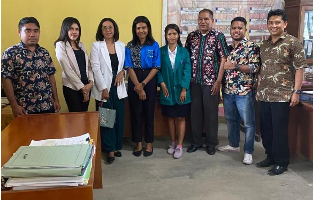
Gambar 1. Foto Bersama Peserta dan Pegawai Dinas Pendapatan Daerah