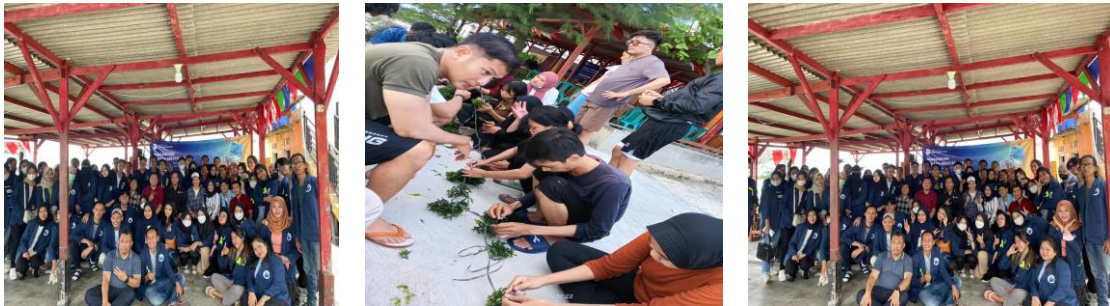
Gambar 2. Kegiatan PKM