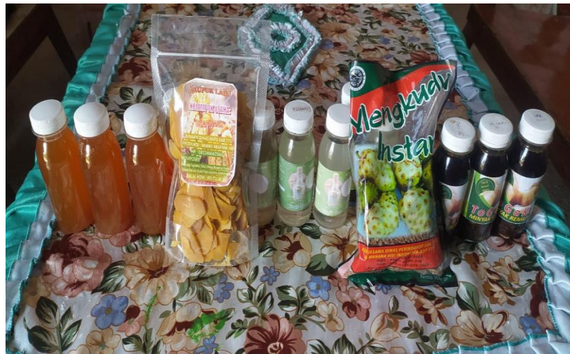
Gambar 3.1. Produk Kelompok Usapinae