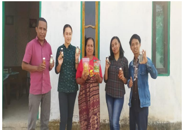
Gambar 3.1. Bersama Ketua Kelompok Usapinae