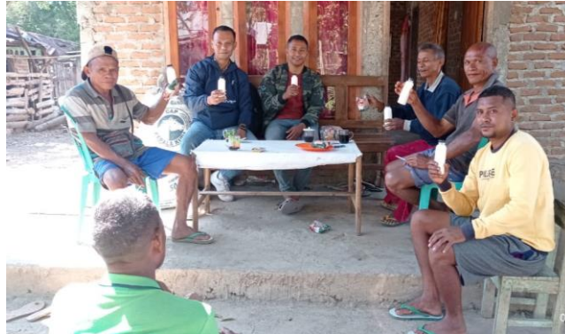
Gambar 2. Foto bersama anggota Kelompok Tani Nunnapa memegang yogurt hasil pelatihan

anggota kelompok tani yaitu turut membantu pada saat proses pembuatan yogurt. Pelatihan pembuatan yogurt secara langsung merupakan sentuhan teknologi fermentasi susu segar menjadi suatu produk baru dengan berbagai rasa serta memberikan efek kesehatan yang baik yang dapat diterima oleh peserta.