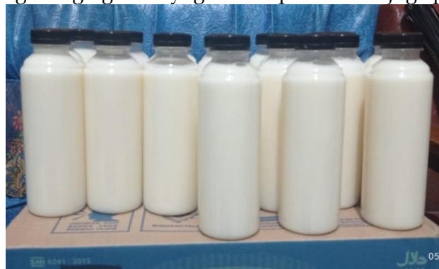
Gambar 4. Produk Yogurt Susu Sapi Hasil Pelatihan di kelompok Tani Nunnapa, Desa Lanaus Kecamatan Insana

Peserta pelatihan mengungkapkan sangat antusias dan ingin mengembangkan diversifikasi olahan susu ini untuk dapat dijadikan sebagai home industri. Pembuatan yoghurt dibuat dengan melihat selera pasar dengan berbagai variasi rasa yang disukai konsumen dari anak-anak sampai dewasa, seperti rasa strawbery, rasa lecy, rasa anggur dan bagi yang menginginkan yoghurt tanpa rasa ada juga plan yoghurt.