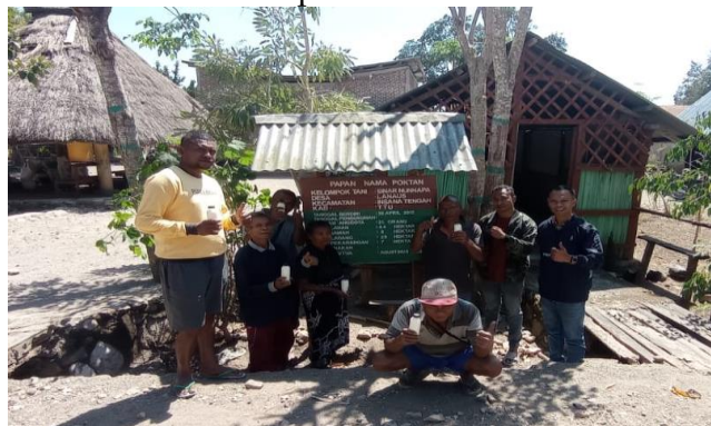
Gambar 3. Foto bersama didapan Rumah Kelompok Tani

Peserta pelatihan mengungkapkan sangat antusias dan ingin mengembangkan diversifikasi olahan susu ini untuk dapat dijadikan sebagai home industri. Pembuatan yoghurt dibuat dengan melihat selera pasar dengan berbagai variasi rasa yang disukai konsumen dari anak-anak sampai dewasa, seperti rasa strawbery, rasa lecy, rasa anggur dan bagi yang menginginkan yoghurt tanpa rasa ada juga plan yoghurt.