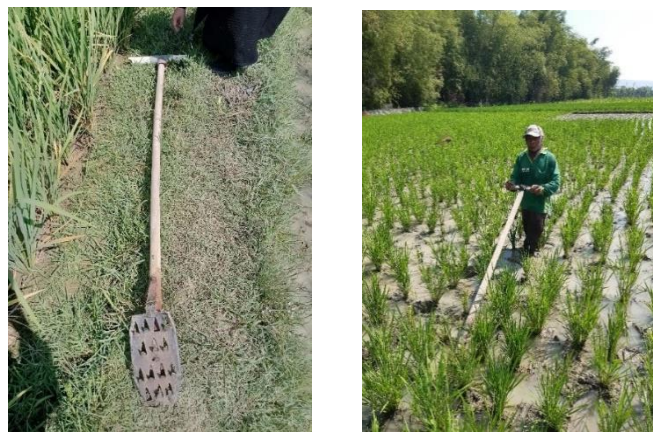
Gambar 3. Pengendalian Gulma Secara Mekanis Tanpa Pestisida

Pengendalian gulma dan hama pada pertanian organik berbeda dengan yang dilakukan pada praktik bertani padi konvensional, pengendaliannya yang ramah lingkungan merupakan salah satu cara dalam menjadi ekosistem disekitarnya. Contoh ini terlihat dari kegiatan petani organik di Desa Rahayu yang dalam melakukan pengendalian gulma pada lahan sawahnya dengan alat sederhana dan dilakukan secara mekanis, selain itu petani organik dalam upaya mengendalikan hama keong di lahan mereka membuat guludan tanah untuk mencegah hama keong masuk ke dalam lahan sawah yang berpotensi merusak padi.