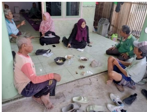
Gambar 4. FGD dalam Pertemuan Rutin Kelompok Tani Mulyo Setiap Hari Kamis

Kelompok tani di Desa Rahayu tercatat saat ini berjumlah dua kelompok yaitu kelompok tani Mulyo dan kelompok tani Makmur dengan total anggota berjumlah \pm 400 petani. Kegiatan rutin yang telah berjalan saat ini perlu ditingkatkan, seperti contohnya kegiatan kumpul bersama setiap hari kamis sebagai ajang bersilaturahmi dan bertukar pikiran tentang permasalahan-permasalahan juga kendala yang dialami setiap anggota kelompok tani, selanjutnya secara bersama-sama menemukan solusi dari permasalahan yang ada.