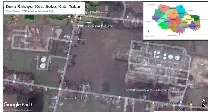
Gambar 1. Lokasi Program di Desa Rahayu

Metode pelaksanaan program ini dapat dirinci sebagai berikut: