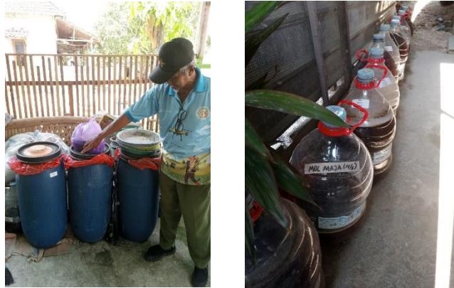
Gambar 4. Drum Fermentasi dan Hasil Pupuk Organik Cair Berbasis MOL

disosialisasikan dan diajarkan kepada petani Desa Rahayu menjadi pupuk organik cair berbasis MOL (mikroorganisme lokal) yang ramah lingkungan pengganti pupuk kimia.