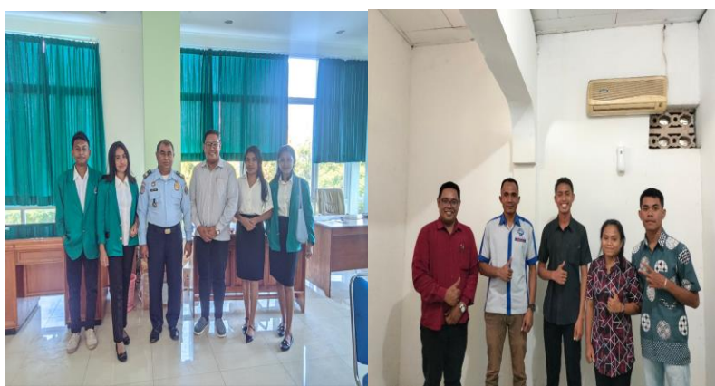
Gambar 1. Foto Bersama Mahasiswa dan Pegawai Kantor Imigrasi dan Koperasi Sangosay Atambua

Dai kegiatan magang mahasiswa maka DPM harus mampu mengarahkan mahasiswa magang untuk berdisiplin dalam bekerja, bertanggungjawab pada tugas/pekerjaan yang diberikan, dan membimbing mahasiswa magang dalam memahami dinamika dalam berorganisasi.