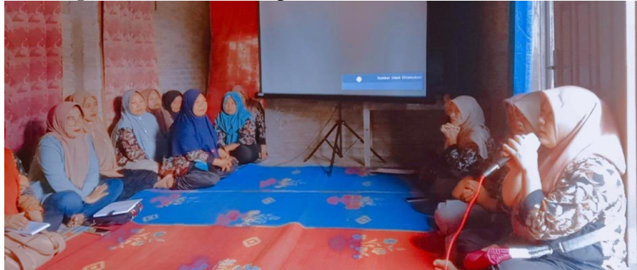
Gambar 3. Sesi sharing dengan KWT Sinar Pagi Pekon Dadapan

Pada tahapan ini, tim pengabdian melatih dan mendampingi memasang dan menampilkan konten digital yang menarik, efektif, variatif, dan inovatif agar semakin mendorong volume penjualan. Setelah itu diharapkan dapat meningkatkan profit atau keuntungan usaha.