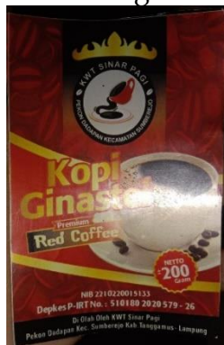
Gambar 2. Desain kemasan produk KWT Sinar Pagi Pekon Dadapan

Pada tahapan ini, tim pengabdian melatih dan mendampingi KWT Sinar Pagi Pekon Dadapan membuat aneka jenis promosi penjualan dengan media sosial dan media online lainnya. Setelah terampil, maka dilanjutkan dengan kegiatan meningkatkan pemanfaatan dan pengelolaan akun digital bisnis sehingga mampu memberikan peningkatan permintaan produk jasa yang dijual yang pada akhirnya akan mendongkrak volume penjualan.