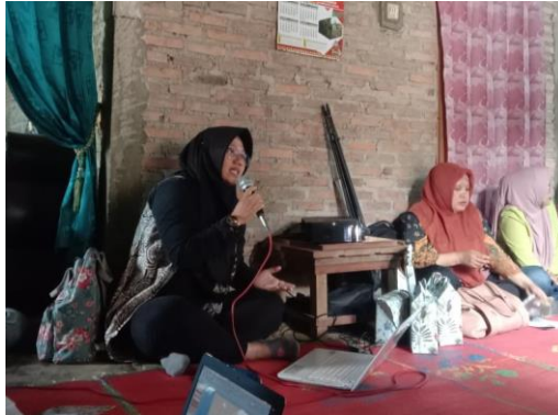
Gambar 1. Memperkenalkan Desain dan Konten Digital

Pagi Pekon Dadapan mengenali dengan baik desain dan konten yang menarik tersebut, maka berikutnya dilanjutkan dengan kegiatan mengupload konten digital tersebut pada marketplace media sosial yang ada dan telah dibuat sebelumnya.