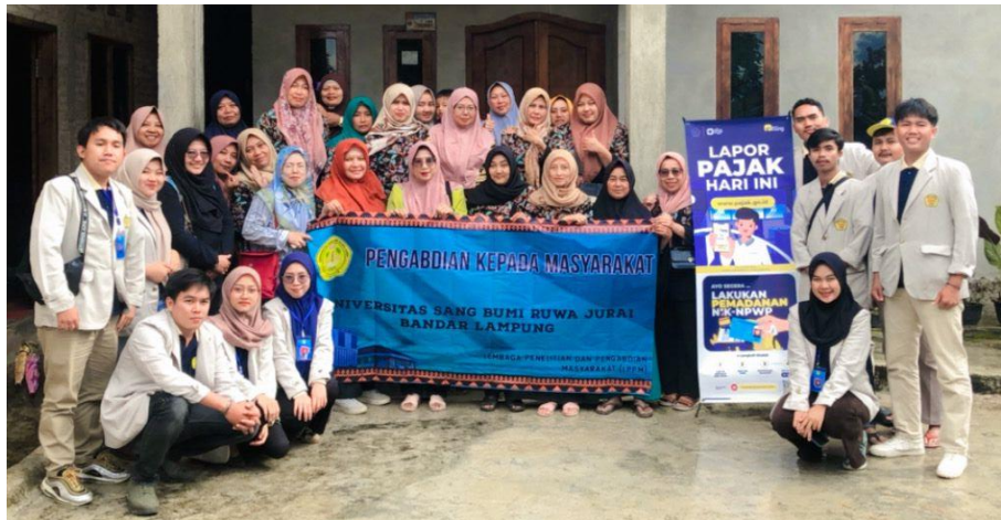
Gambar 4. Foto bersama dengan pesertaSize 12 dan Spasi 1.0).