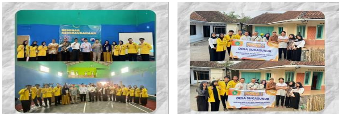
Gambar 1. Kegiatan Pengabdian

sektor UMKM di era digital marketing. Penelitian ini menunjukkan bahwa peningkatan kualitas SDM dapat dicapai melalui pelatihan, pendidikan, penjadwalan konten media sosial, dan pengenalan media sosial di berbagai lingkungan. Hasil penelitian ini dapat menjadi landasan penting bagi pelaku UMKM dan peneliti lain sebagai acuan untuk pengembangan lebih lanjut dibidang ini.