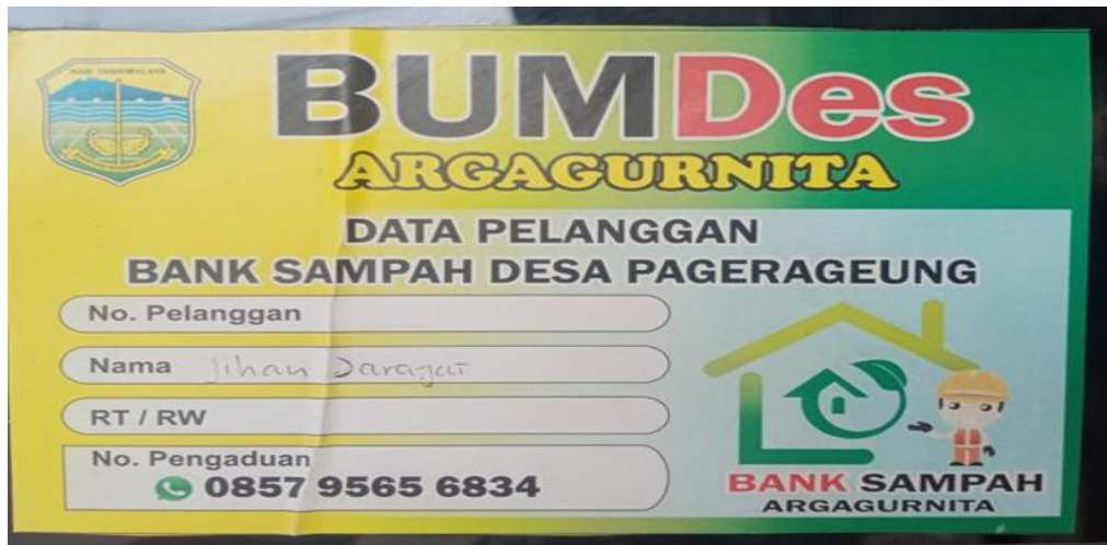
Gambar1. Stiker Keanggotaan BUMDes