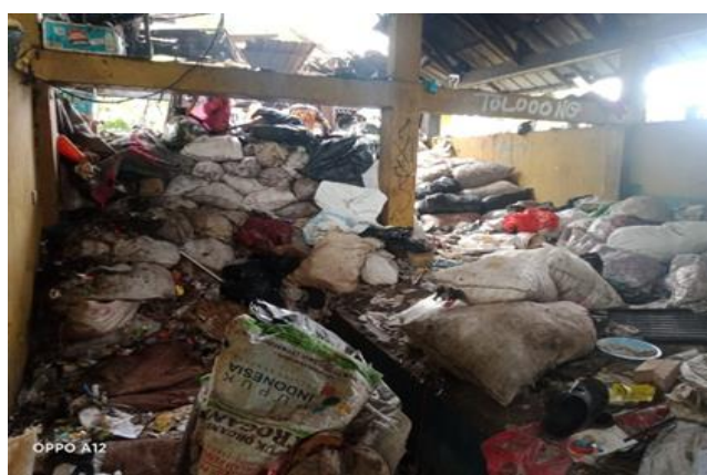
Gambar 2. Tempat Bank Sampah