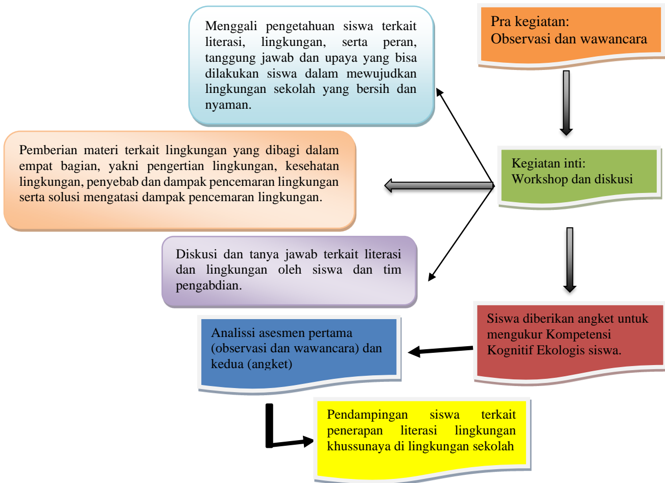
Bagan 1: Tahapan Pelaksanaan Kegiatan

Kegiatan pengabdian ini dilaksanakan di SMP Katolik St. Yoseph Freinademetz, Desa Kapan, Kab. Timor Tengah Selatan, Nusa Tenggara Timur. Kegiatan ini diikuti oleh 28 siswa kelas IX. Sebelum dilaksanakan kegiatan inti, para tim pengabdian melakukan observasi serta wawancara awal kepada para peserta terkait literasi lingkungan serta penerapan budaya literasi di sekolah. Selain itu, observasi terkait lingkungan sekolah juga dilakukan sebelum materi workshop dilakukan. Pada akhir kegiatan, pelaksana kegiatan melakukan wawancara serta pendampingan pada siswa untuk melihat kompetensi ekologis siswa berkaitan dengan penerapan materi edukasi literasi keologis yang telah diberikan. Adapun tahapan pelaksanaan kegiatan akan dijabarkan dalam bagan berikut: