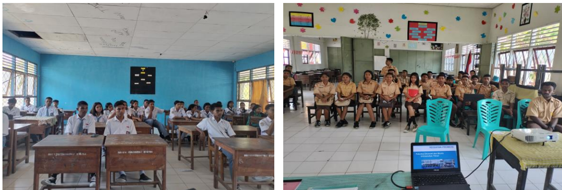
Gambar 1 dan 2. Peserta Kegiatan Sospro

Materi yang disampaikan pada kegiatan sospro mulai dari penjelasan tentang PT secara umum, sejarah Unimor dan fakultas yang ada didalamnya, serta keberadaan FEB (Prodi Manajemen dan Ekonomi Pembangunan) yang berkaitan dengan dosen dan tendik, jalur penerimaan mahasiswa, biaya kuliah, beasiswa, fasilitas yang tersedia, kurikulum yang digunakan, unit kegiatan mahasiswa, prestasi yang diraih, dan persiapan pembukaan prodi baru (Akuntansi). Selanjutnya diskusi (sesi tanya jawab), siswa/i diberikan kesempatan untuk bertanya terkait materi yang sudah disampaikan untuk mendapatkan kejelasan informasi dan pengetahuan yang lebih mendetail.