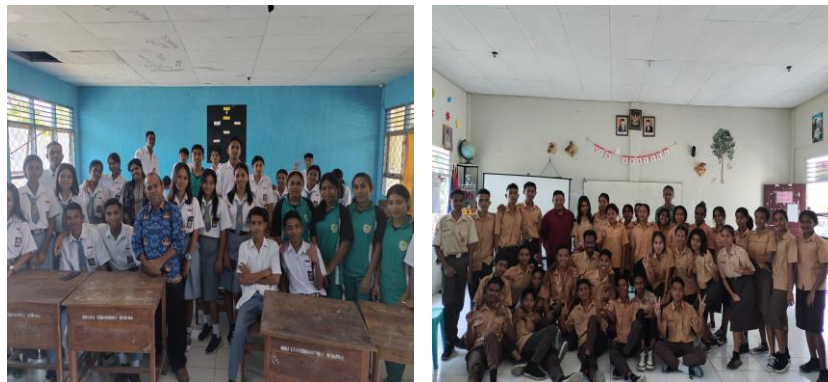
Gambar 6 dan 7. Foto Bersama Peserta Sospro