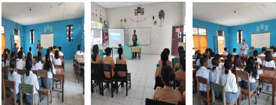
Gambar 3, 4, dan 5. Penyampaian Materi Sospro

Materi yang disampaikan pada kegiatan sospro mulai dari penjelasan tentang PT secara umum, sejarah Unimor dan fakultas yang ada didalamnya, serta keberadaan FEB (Prodi Manajemen dan Ekonomi Pembangunan) yang berkaitan dengan dosen dan tendik, jalur penerimaan mahasiswa, biaya kuliah, beasiswa, fasilitas yang tersedia, kurikulum yang digunakan, unit kegiatan mahasiswa, prestasi yang diraih, dan persiapan pembukaan prodi baru (Akuntansi). Selanjutnya diskusi (sesi tanya jawab), siswa/i diberikan kesempatan untuk bertanya terkait materi yang sudah disampaikan untuk mendapatkan kejelasan informasi dan pengetahuan yang lebih mendetail.