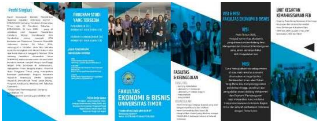
Gambar 1. Leaflet Fakultas Ekonomi dan Bisnis, Unimor

Kegiatan Pengabdian kepada Masyarakat ini dilaksanakan dengan metode sosialisasi dan promosi. Sebelum memulai sosialisasi dan promosi, tim SOSPRO terlebih dahulu membagikan Brosur (leaflet) kepada para peserta agar peserta dapat membacanya terlebih dahulu. Leaflet tersebut berisikan visi, misi, tujuan prodi, kontak informasi, ekstrakurikuler, fasilitas, tenaga pengajar, akreditasi setiap prodi, penerimaan mahasiswa dan prospek lulusan, yang dapat dilihat pada Gambar 1. Leaflet perlu diberikan bukan hanya untuk menyajikan informasi tetapi juga agar menambah keingintahuan peserta, dengan harapan dapat membantu sehingga tujuan dari SOSPRO dapat tercapai (Ruyadi et al., 2017).