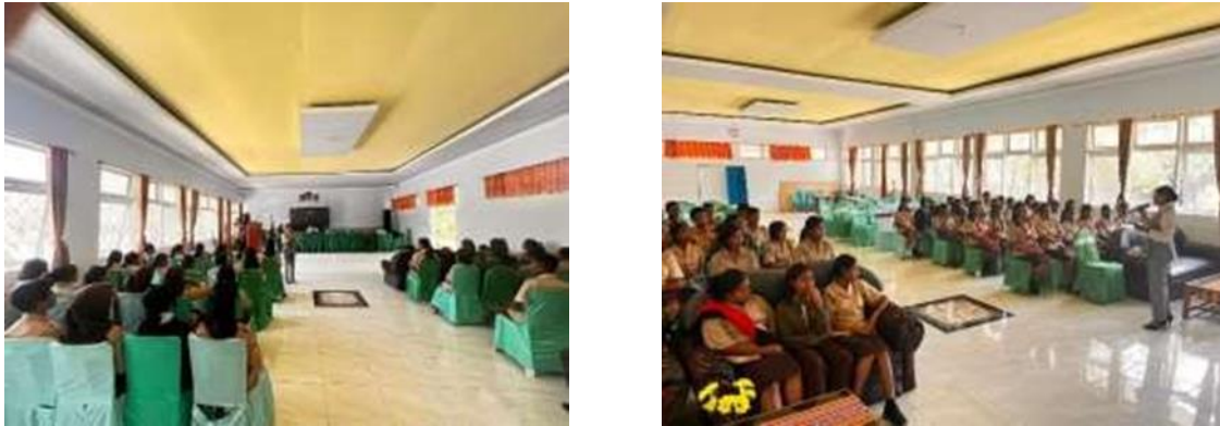
Gambar 2. Kegiatan Sosialisasi dan Promosi Fakultas

UKTnya masing-masing. Hal ini bertujuan untuk memotivasi peserta agar diharapkan peserta terus melanjutkan pendidikannya pada FEB, Unimor. Proses ceramah terkait SOSPRO FEB, Unimor pada SMKN 2 Soe dapat dilihat pada Gambar 2.