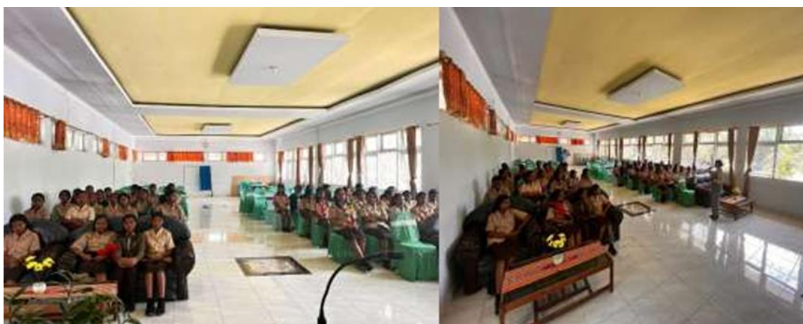
Gambar 3. Kegiatan Diskusi Saat Sosialisasi

Sosialisasi dilanjutkan dengan tanya jawab dan disertai diskusi, dapat dilihat pada gambar 3. Pada tahap ini adanya partisipasi aktif dari peserta untuk menanyakan hal-hal yang mereka tidak mengerti atau menjawab pertanyaan yang diberikan kepada mereka. Mereka terlihat antusias dengan sosialisasi ini terlebih karena biaya kuliah setiap prodi dalam fakultas ekonomi dan bisnis, Unimor yang masih tergolong murah. Kebanyakan dari peserta bertanya mengenai prospek kedepan terkait peluang kerja dari prodi manajemen dan ekonomi pembangunan. Selain itu beberapa peserta juga baru mengetahui keberadaan Fakultas Ekonomi dan Bisnis Unimor, dimana mereka menanyakan letak lokasi kampus, terdapat berapa program studi secara keseluruhan.