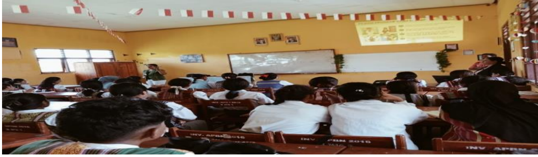
Gambar 3. Kegiatan Diskusi

D. Tahap IV merupakan tahap terakhir dalam sosialisasi yang mana tim membuat laporan kegiatan terkait kegiatan sosialisasi yang dilakukan sebagai laporan telaksananya kegiatan sosialisasi baik dari tahap koordinasi hingga tahap sosialisasi.