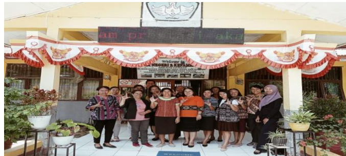
Gambar 1. Kegiatan setelah koordinasi dengan Kepala Sekolah