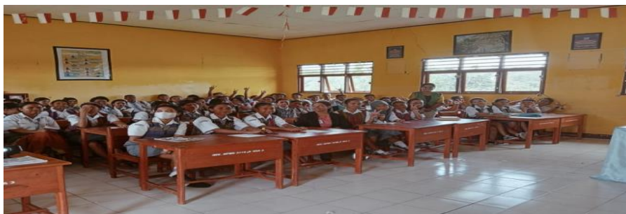
Gambar 2. Sosialisasi dan Promosi