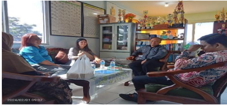
Gambar 9. Silaturahmi sekaligus penyerahan kenang-kenangan

Dan hasil kinerja Pengabdian Kepada Masyarakat antara mahasiswa dan guru ke Pondok Pesantren Binaul Ummah dibuatlah laporan kegiatan Bersama agar hasil yang didapat sangat memuaskan.