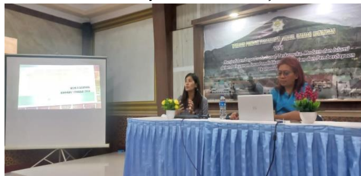
Gambar 5. TIM Evaluasi workshop dan pelatihan pengolahan sampah

Setelah selesai dilakukan workshop yang dpata dilihat pada Gambar 5, maka TIM PKM melakukan evaluasi terhadap hasil dari pelatihan di depan Kepala Pembina dan Pengawas Kab. Kuningan agar mengetahui kelebihan dan kekurangan untuk selanjutnya dapat dikembangkan. Dengan adanya pelatihan dan workshop dapat menambah pengetahuan dalam kurikulum Merdeka yang sedang berjalan dimana salahsatunya ada mata Pelajaran P5.