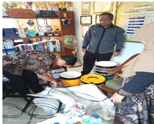
Gambar 3. Persiapan materi

Selesai pertemuan awal, maka didampingi wakil kepala sekolah kesiswaan Tim PKM mempersiapkan alat-alat dan materi sambil menunggu rekan-rekan guru seperti pada Gambar 3