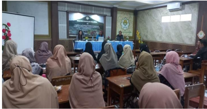
Gambar 4. Sosialisasi dan workshop di depan Guru- guru Pondok Pesantren

Setelah selesai dilakukan workshop yang dpata dilihat pada Gambar 5, maka TIM PKM melakukan evaluasi terhadap hasil dari pelatihan di depan Kepala Pembina dan Pengawas Kab. Kuningan agar mengetahui kelebihan dan kekurangan untuk selanjutnya dapat dikembangkan. Dengan adanya pelatihan dan workshop dapat menambah pengetahuan dalam kurikulum Merdeka yang sedang berjalan dimana salahsatunya ada mata Pelajaran P5.