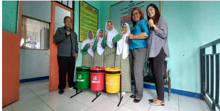
Gambar 7. Sosialisasi pemilahan sampah yang dilakukan oleh mahasiswa kepada siswa- siswi di Pondok Pesantren

Namun TIM PKM kurang puas jika melakukan sosialisasi didepan guru. Dengan seizin pimpinan, maka dilakukan juga sosialisasi pengolahan sampah dan pemilahan agar siswa lebih paham dengan adanya tong sampah 3 warna. Penjelasan penempatan sampah berdasarkan kategorinya dan warna pada Tong sampah oleh mahasiswa seperti pada Gambar 7