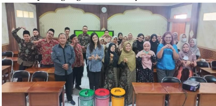
Gambar 6. Peserta workshop dan pelatihan foto bersama

Dengan berakhirnya evaluasi dan ditutup oleh Perwakilan Diknas Kab. Kuningan, maka tim PKM melakukan foto bersama sebagai penutupan workshop seperti pada Gambar 6. Dengan foto bersama dapat mencairkan suasana yang tadi sempat tegang karena adanya evaluasi.