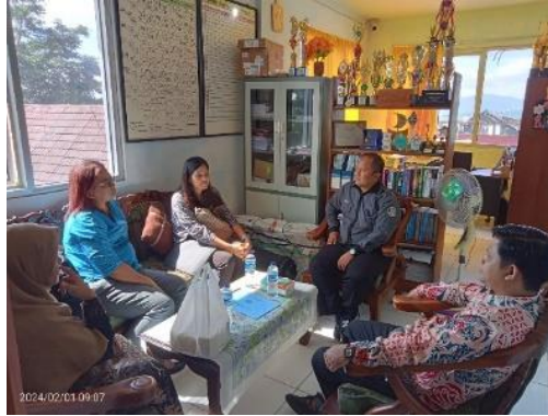
Gambar 2. Pertemuan awal dengan Kepala Sekolah

Selesai pertemuan awal, maka didampingi wakil kepala sekolah kesiswaan Tim PKM mempersiapkan alat-alat dan materi sambil menunggu rekan-rekan guru seperti pada Gambar 3