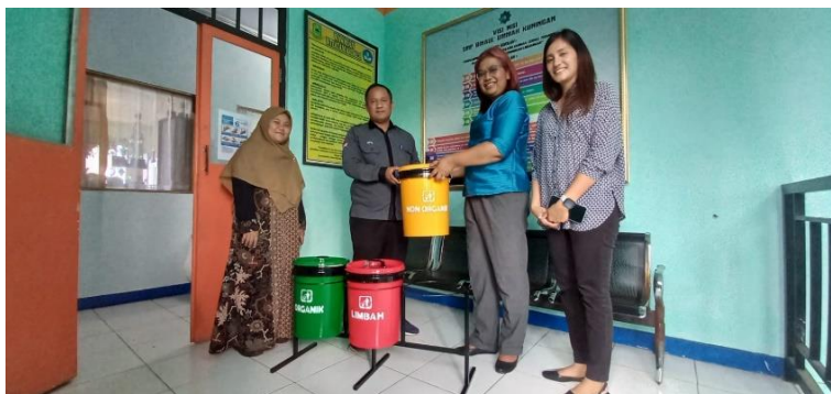
Gambar 8. Penyerahan hibah Tong sampah hasil karya mahasiswa Teknik Mesin UKI

Setelah selesai sosialisasi sampah baik ke Guru maupun siswa, maka TIM PKM melakuakn penyerahan hibah Tong sampah 3 warna kepada sekolah baik Tingkat SMP dan SMA Binaul Ummah seperti pada Gambar 8. Tong sampah ini merupakan hasil karya mahasiswa sebagai aplikasi dari mata kuliah Pengelasan di Teknik Mesin UKI.