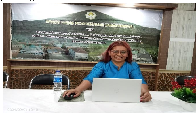
Gambar 10. Pembuatan laporan kegiatan Bersama-sama

Dan hasil kinerja Pengabdian Kepada Masyarakat antara mahasiswa dan guru ke Pondok Pesantren Binaul Ummah dibuatlah laporan kegiatan Bersama agar hasil yang didapat sangat memuaskan.