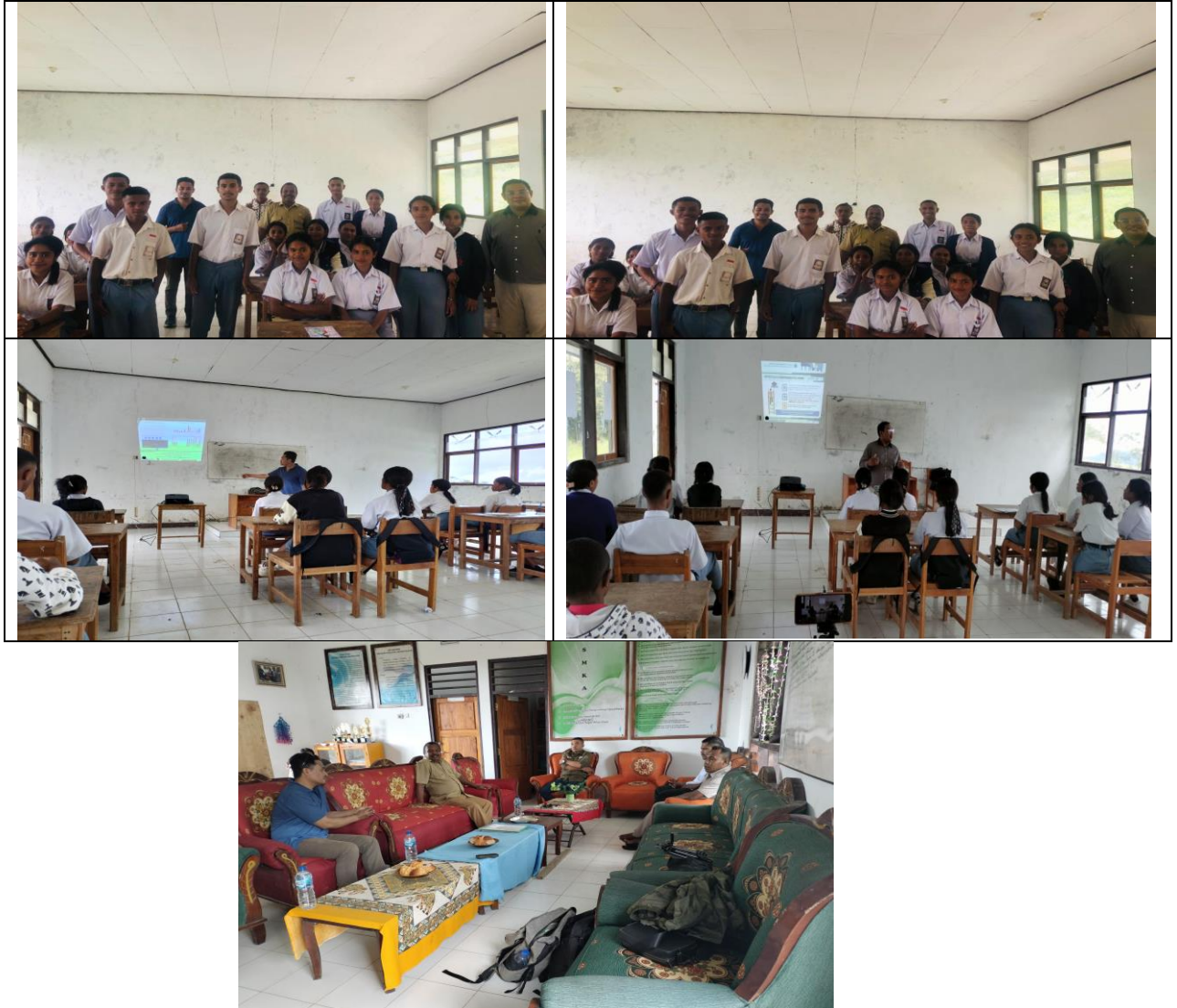
Gambar Kegiatan Sospro SNPMB Tahun 2024

halangan apapun, dan peserta juga tampak menikmati kegiatan ini, karena diselingi dengan canda tawa agar tidak bosan. Sehingga rasa puas dirasakan oleh seluruh pihak, khususnya para siswa karena mereka mendapatkan informasi yang mereka butuhkan. Presentase dari kelangsungan kegiatan ini adalah 80% dilihat dari antusias seluruh peserta dan kelancaran jalannya sospro.