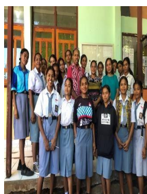
Gambar 2. Presentasi Pada Siswa/I Terkait Promosi Penerimaan Mahasiswa Baru