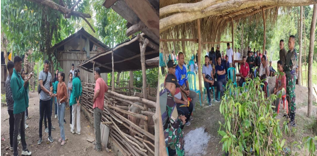
Gambar 1 Pelaksanaan PKM