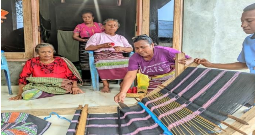
Gambar 3: Penjelasan proses pembuatan kain tenun