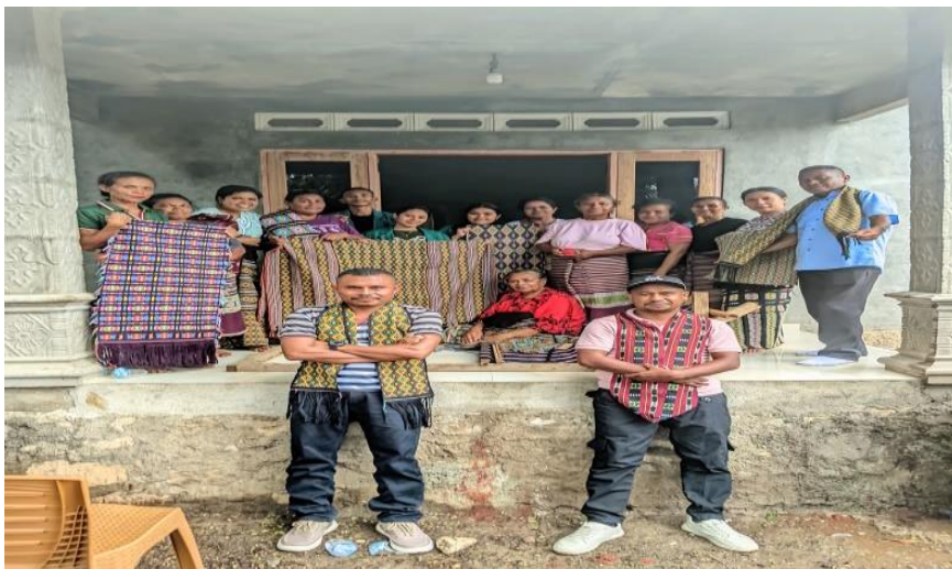
Gambar 4: Hasil Produk Kain Tenun