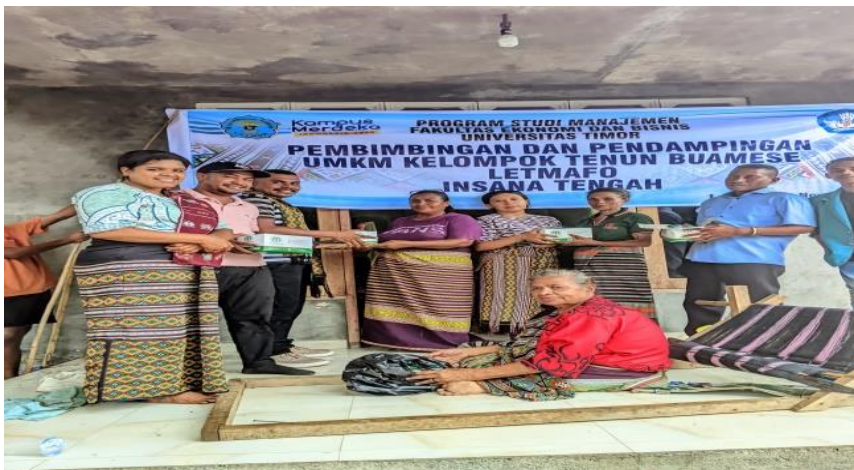
Gambar 2: Kegiatan Pendampingan UMKM