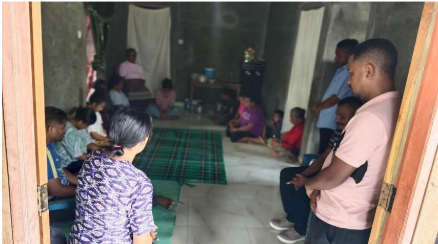
Gambar 1: Kegiatan Koordinasi dengan keompok tenun Buamese

Kegiatan Pengabdian kepada masyarakat berupa pendampingan UMKM kelompok tenun Buamese desa Letmafo, dilaksanakan selama 4 hari yaitu dimulai dari tahap persiapan, survey, koordinasi dan tahap pelaksanaan. Kegiatan pelaksanaan pendampingan dilakukan pada tanggal 21-22 November 2024 bertempat di rumah ketua kelompok yang terletak di Desa Letmafo Kecamatan Insana Tengah. Kegiatan pendampingan berjalan dengan baik dan lancar yang dihadiri oleh Ketua dan 15 orang Anggota. Pelaksanaan pendampingan dilakukan dengan penyampaian materi oleh Tim pengabdian dan tanya jawab/diskusi oleh kelompok tenun Buamese desa Letmafo serta penjelasan proses pembuatan tenun secara tradisional oleh kelompok kepada tim pengabdian kepada masyarakat. Kegiatan ceramah terkait strategi pemasaran kain tenun menghasilkan informasi berupa cara untuk bisa bersaing dipasar dengan produk berkualitas yang dihasilkan, perencanaan kegiatan proses pengumpulan bahan baku dan biaya-biaya serta pemasaran produk tenun baik dipasar tradisional maupun secara online.