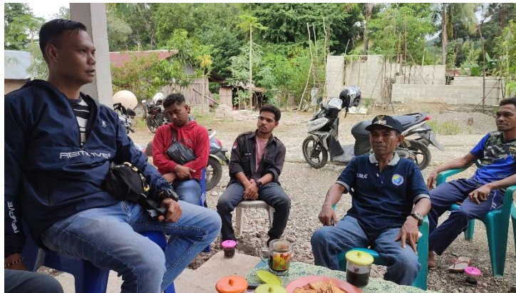
Gambar 1. foto team pengabdian bersama Kepala Desa Manamas

Metode yang digunakan dalam pengabdian ini terdiri dari beberapa tahap, yaitu tahap persiapan, tahap pemberian materi tentang pakan ternak dan kesehatan, serta tahap pendampingan pelatihan. Pada tahap persiapan, dilakukan identifikasi kebutuhan peternak di Desa Manamas melalui survei dan wawancara. Survei ini bertujuan untuk mengetahui tingkat pengetahuan dan keterampilan peternak mengenai pakan dan kesehatan ternak. Data yang diperoleh dari survei ini menjadi dasar untuk merancang materi pelatihan yang sesuai.