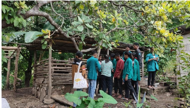
Gambar 3. Pelayanan Kesehatan Dengan Pemberian Pengobatan Dan Vitamin Pada Ternak

penyakit pada ternak mereka. Setelah pelatihan, peternak mulai lebih peka terhadap kondisi kesehatan ternak dan melaporkan gejala yang tidak biasa kepada tenaga kesehatan ternak. Hal ini berkontribusi pada penurunan angka kematian ternak di Desa Manamas, yang sebelumnya mencapai 15% per tahun, kini bisa ditekan menjadi 5%.