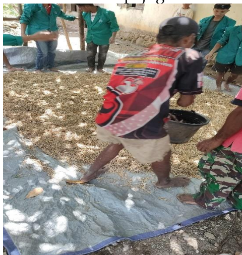
Gambar 2. Pendampingan Pembuatan Pakan Ternak

Selain itu, hasil pelatihan juga terlihat dari praktik pembuatan pakan ternak yang dilakukan oleh peternak. Banyak peternak yang mulai mencoba membuat pakan ternak dari bahan lokal, seperti hijauan, dedak, dan limbah pertanian. Menurut data dari Dinas Pertanian dan Peternakan NTT, penggunaan pakan lokal dapat mengurangi biaya pakan hingga 40% (Dinas Pertanian dan Peternakan NTT, 2020). Ini merupakan langkah positif yang tidak hanya meningkatkan produktivitas ternak tetapi juga menekan biaya produksi.