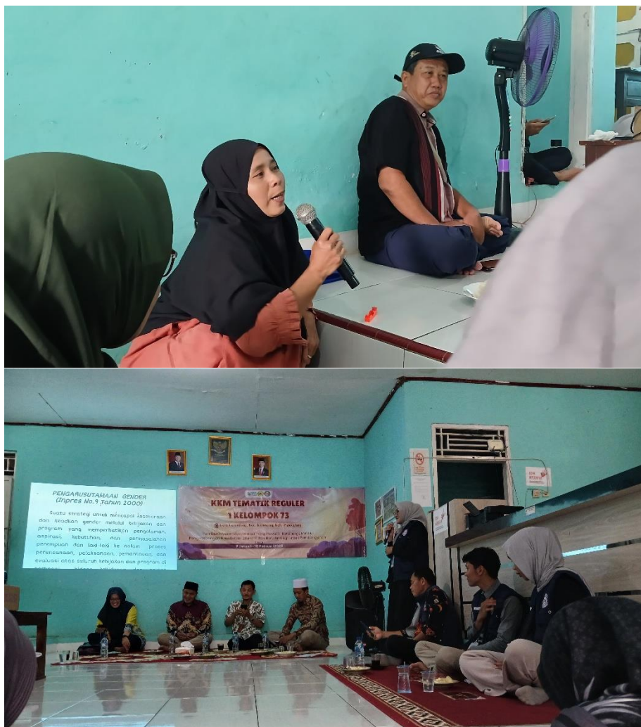
Gambar 3.1. Dokumentasi Kegiatan Sosialisasi

Sosialisasi ini diterima dengan baik oleh para peserta yang terlihat dari keaktifan mereka dalam sesi diskusi terkait isu-isu strategis yang disampaikan oleh narasumber, seperti pengarusutamaan gender, peran perempuan dalam pencapaian SDGs, serta pemanfaatan dana desa yang responsif. Dengan adanya sosialisasi ini, para perempuan di Desa Gerendong memperoleh pemahaman baru mengenai arah dan peluang pemberdayaan di tingkat desa. Mereka mulai memahami bahwa keterlibatan aktif perempuan dapat menjadi bagian penting dari strategi pembangunan desa yang lebih inklusif dan berkelanjutan. Melalui kegiatan ini, peserta mendapatkan peningkatan wawasan dan semangat baru untuk berkontribusi dalam penyelesaian masalah sosial-ekonomi yang mereka hadapi sehari-hari, sekaligus mendorong kemandirian komunitas melalui inisiatif lokal yang berkelanjutan.