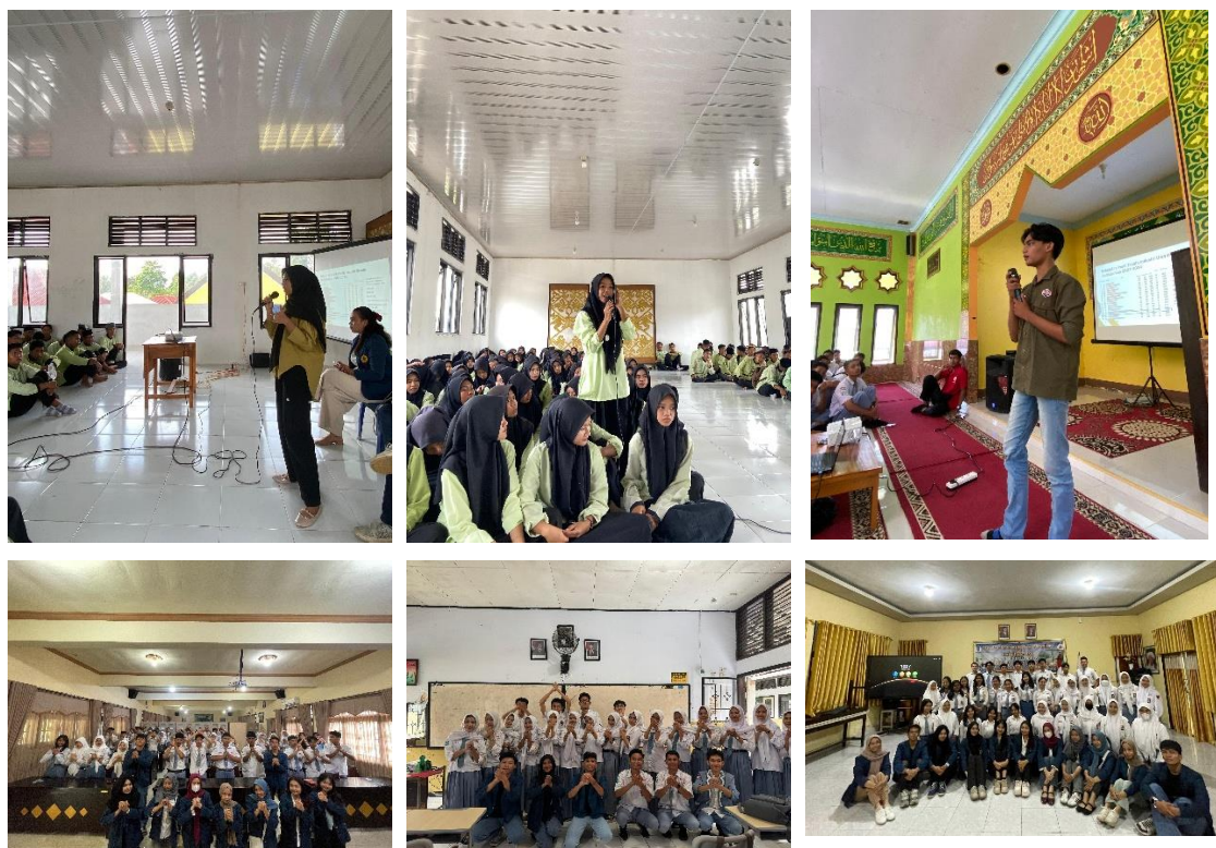
Gambar 3.1. Kegiatan Sosialisasi dan Promosi SNPMB 2025

Kegiatan sosialisasi dan promosi diikuti oleh siswa/i SMA kelas 12 dilaksanakan dengan 2 sesi, yaitu sesi pemaparan materi dan sesi diskusi tanya jawab. Pada sesi pemaparan disampaikan informasi terkait profil Universitas dan Program Studi, serta informasi tentang SNPMB 2025 yang terdiri dari 3 jalur, SNBP, SNBT, Mandiri. Setelah sesi pemaparan selesai, kegiatan dilanjutkan dengan sesi diskusi tanya jawab, pada sesi ini siswa/i SMA dipersilahkan untuk bertanya terkait informasi SNPMB 2025, maupun hal-hal yang terkait dengan Program Studi. Antusiasme yang ditunjukkan oleh siswa/i yang mengikuti kegiatan sosialisasi dan promosi cukup tinggi, terlihat dari siswa/i yang aktif memberikan pertanyaan kepada tim sosialisasi. Pada akhir sesi siswa/i diberikan link brosur Program Studi Teknik Industri, yang berisi profil Program Studi serta fasilitas penunjang. Sehingga pada akhir kegiatan, siswa/i mendapatkan informasi yang jelas dan resmi mengenai profil Universitas, Program Studi, dan SNPMB 2025.