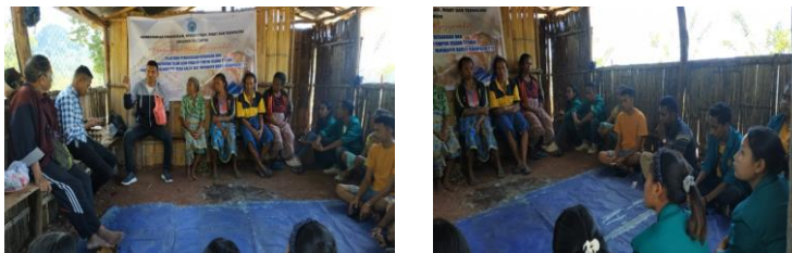
3.2 Gambar 2 penjelasan tentang pembuatan telur asin