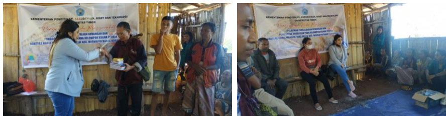
Gambar 3.1 penyampain materi tentang pengelolaan keuangan

Setelah pelatihan pengelolaan keuangan bagi usaha kelompok Haukteas Karya Mandiri, tim melakukan tahap akhir yaitu melakukan pendampingan dengan cara memberikan beberapa buku jurnal dan cara penyusunan laporan keuangan dengan tujuan kelompok usaha ini dapat mengetahui perkembangan usahanya melalui pembukuan yang baik dan sistematis. Seperti yang diketahui bahwa pencatatan laporan keuangan memiliki manfaat yaitu dapat memberikan informasi keuangan mengenai hasil usaha dan 1 periode akuntansi, dapat membantu pihak berkepentingan untuk menilai kondisi dan potensi usaha serta dapat memberikan informasi penting lainnya yang relevan dengan pihak yang berkepentingan.