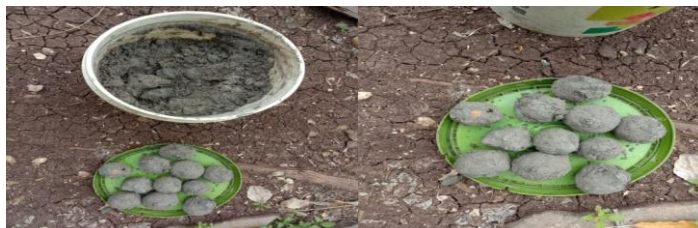
Gambar 3.3 Hasil telur setelah disimpan selama 12 hari