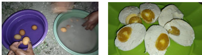
Gambar 3.4 Dokumentasi hasil pembuatan telur