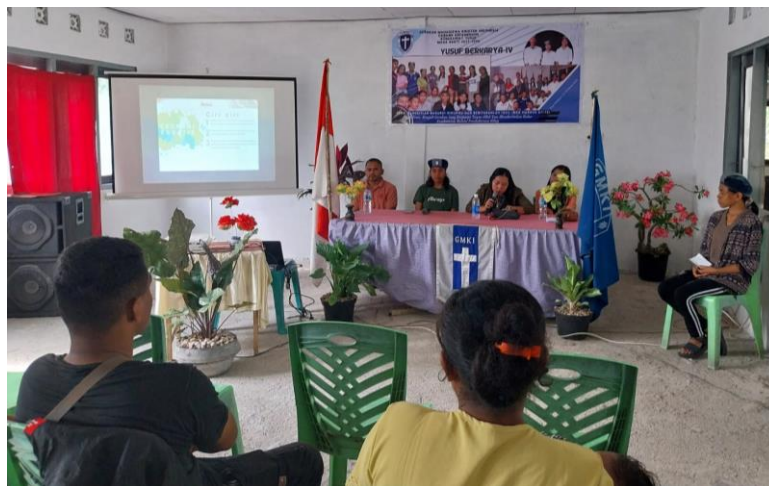
Gambar 3.1. TIM Pengabdian sedang menyampaikan materi

Pengakuan dari peserta dalam diskusi menyampaikan bahwa selama ini mereka belum memahami dengan benar tentang peran dan fungsi dari Lembaga koperasi, sehingga lewat penyampaian materi ini mendorong masyarakat dan pemerintah desa untuk membentuk sebuah koperasi desa, dan koperasi ini kemudian akan membantu dalam peningkatan ekonomi di desa dan masyarakat. Respon peserta terhadap kegiatan ini sangat baik yang terlihat dari perhatian peserta saat pemaparan materi dan antusiasme mereka dalam sesi diskusi. Masyarakat berharap kegiatan seperti ini dapat dilaksanakan secara rutin karena sangat bermanfaat dan mereka meminta agar dapat ditindaklanjuti dengan pendampingan sehingga pemahaman, pengetahuan dan wawasan mereka bisa bertambah.