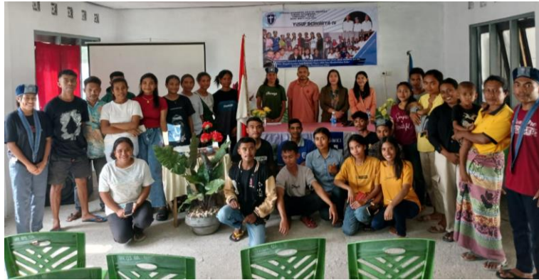
Gambar 3.3 Foto bersama peserta.