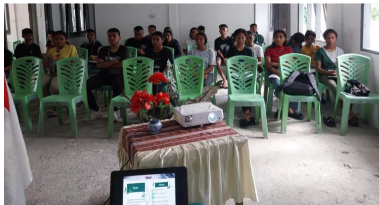
Gambar 3.2. Peserta kegiatan sedang menyimak materi