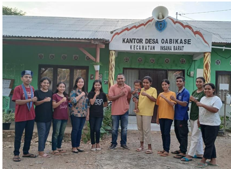
Gambar 3.4. Foto Bersama panitia GMKI Kefamenanu