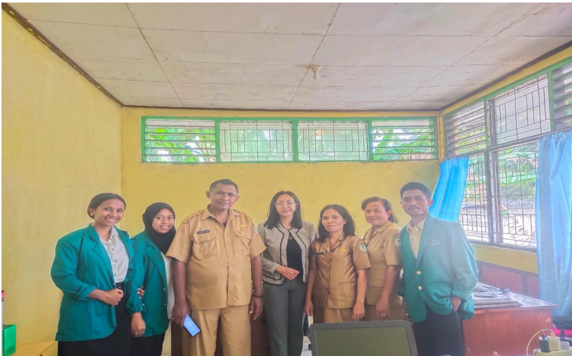
Gambar 3.1 Foto Bersama Peserta dan Pegawai Dinas Koperasi dan UMKM

Para pemegang sudah dapat memahami dan mengerjakan tugas dan pekerjaan yang terdapat di Dinas Koperasi dan UMKM dengan baik mulai dari pendataan investaris kantor, pendataan pelaku UMKM dari Desa ke Desa, mengandekan surat masuk dan surat keluar, pelaksanaan sosialisasi terkait kredit mikro merdeka yang ditujukan kepada para kelompok tani dan UKM-UKM di setiap Desa. Peserta magang setelah selesai melakukan magang di Dinas Koperasi dan UMKM TTU harus menyerahkan laporan magang yang berisi segala kegiatan yang dilakukan selama kurang lebih 50 hari kerja di kantor Dinas tersebut. Sehingga dari laporan itu digunakan sebagai dasar pemberian penilaian dari Dosen Pendamping Magang. Evaluasi penilaian bukan hanya dari Dosen Pendamping Magang tetapi juga dari Pendamping Lapangan dari kantor Dinas Koperasi dan UMKM dimana Pendamping Lapangan mengevaluasi pekerjaan pemegang selama bekerja dengan mereka di kantor tersebut.