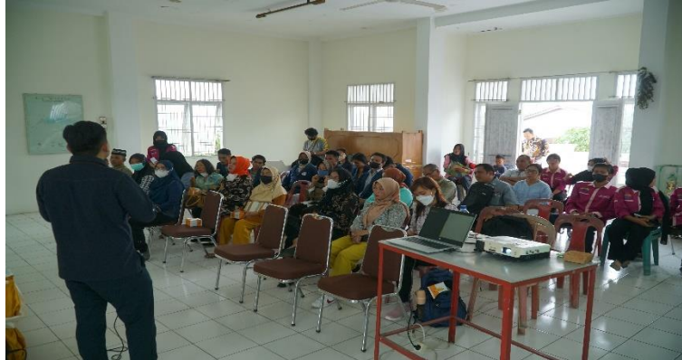
Gambar 1. Kegiatan PKM Literasi Investasi

produk keuangan ini. Sehingga memperkecil kemungkinan para pemain di pasar modal ini menjadi korban investasi bodong karena telah dibekali pengetahuan tentang ilmu keuangan atau dapat disebut dengan kelompok literasi keuangan yang memadai (Kemu, 2016).