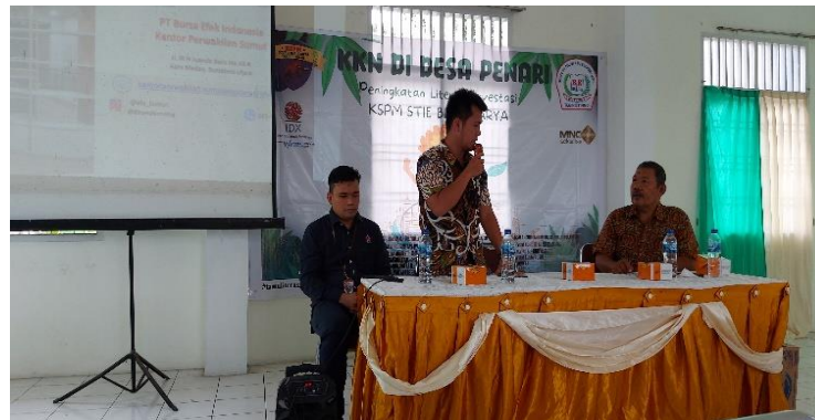
Gambar 2. Pemaparan materi tentang literasi investasi

Pengetahuan investasi adalah berbagai pemahaman yang harus dimiliki oleh individu mengenai aspek pendukung seperti efek dari suatu investasi yang dilakukan, dimana berawal dari sebuah pengetahuan yang paling mendasar terkait dengan evaluasi investasi, dan imbal hasil pada tingkat pengembalian investasi yang diharapkan (Listyani et al., 2019). Literasi investasi yang telah dilakukan tim pengabdian kepada masyarakat dan KSPM STIE Bina Karya dilakukan dengan pemaparan materi oleh narasumber yang kompeten di bidangnya berasal dari BEI Perwakilan Sumatera Utara seperti terlihat di gambar 2.