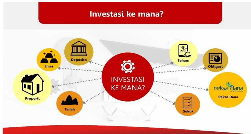
Gambar 4. Materi Bentuk Investasi

Pertama, narasumber menjelaskan produk investasi apa yang calon investor bisa investasikan. Ini dapat dilihat di gambar 4. Ternyata yang dilakukan si Ibu itu bukan merupakan investasi karena tidak termasuk dalam produk-produk investasi sebagaimana terlihat di gambar 4. Berikutnya, narasumber menjelaskan bagaimana calon investor mengetahui investasi yang sehat. Investor melakukan investasi yang sehat dan aman jika saham yang ingin dibeli telah dan harus terdaftar di IDX (Indonesia Stock Exchange) (Bursa Efek Indonesia) seperti terlihat pada gambar 5. BEI diibaratkan mall yang terdiri dari ratusan toko dengan berbagai produk atau barang yang ditawarkan ke pembeli yang berkunjung. Sudah pasti mall ini resmi dan dilindungi secara hukum (memiliki badan hukum) (Edison et al., 2019) .