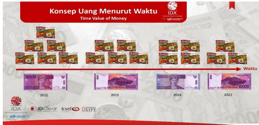
Gambar 3. Konsep Uang Menurut Waktu

Dengan bertambahnya waktu, berkurang pula jumlah barang yang bisa diperoleh pada nominal uang yang sama. Seperti di gambar 3 terlihat bahwa pada tahun 2012 uang sejumlah sepuluh ribu rupiah dapat ditukar dengan enam bungkus mi instan. Kemudian pada tahun 2015 terjadi perubahan jumlah mi instan yang dapat diperoleh dengan jumlah uang yang sama yaitu menurun menjadi lima bungkus mi instan. Tiga tahun kemudian juga mengalami pergeseran jumlah barang dengan nominal yang sama, yaitu uang senilai sepuluh ribu rupiah dapat ditukar dengan empat bungkus mi instan, dan berlanjut ke tahun 2022, uang sejumlah sepuluh ribu rupiah hanya mampu ditukar dengan tiga bungkus mi instan. Hal ini menunjukkan semakin menurunnya nilai mata uang atau yang disebut inflasi. Maka melalui investasi, investor ditawarkan akan mampu memiliki kesejahteraan hidup karena memiliki asset masa depan dan serta berpeluang memiliki penghasilan tetap tentunya ini sebagai indikator pembangunan ekonomi (Siti et al., 2021)