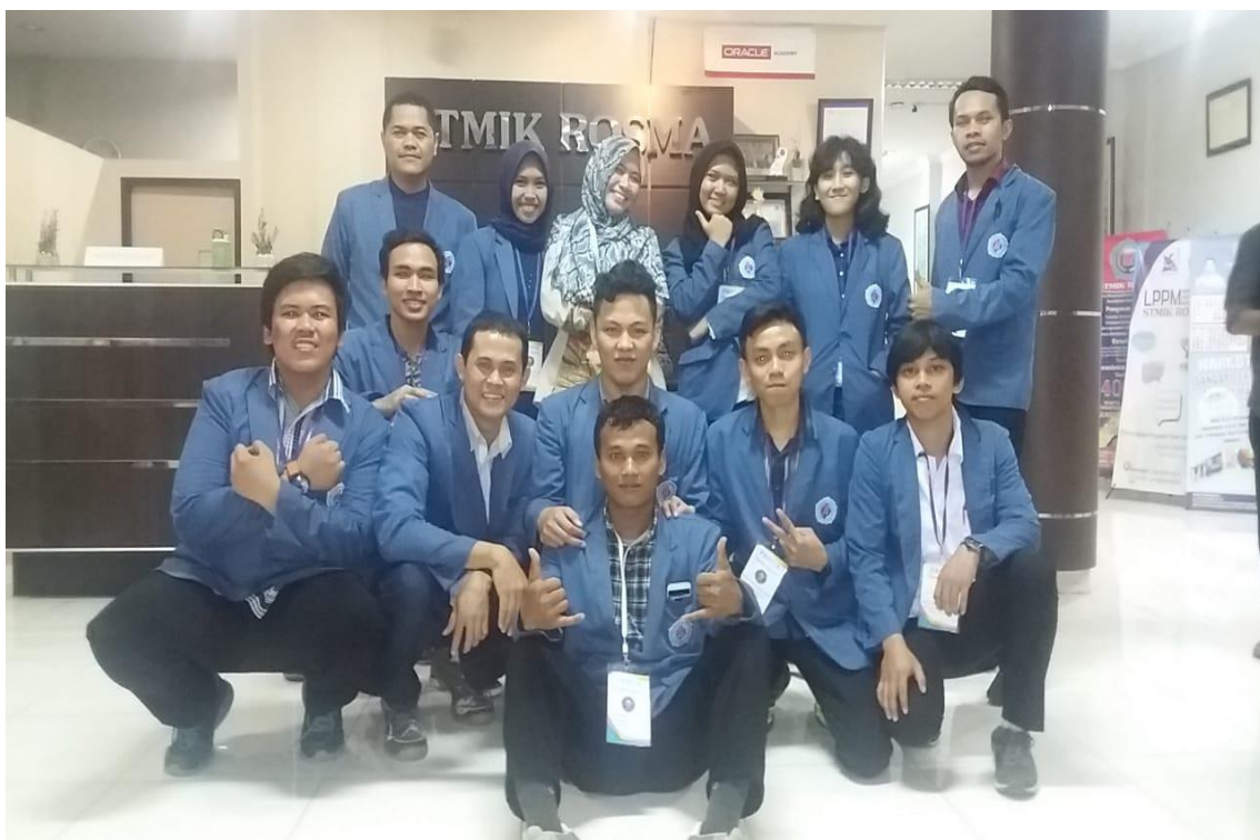
Gambar 3.2 Pelatih dan Mahasiswa Program Studi Manajemen Informatika, 2018