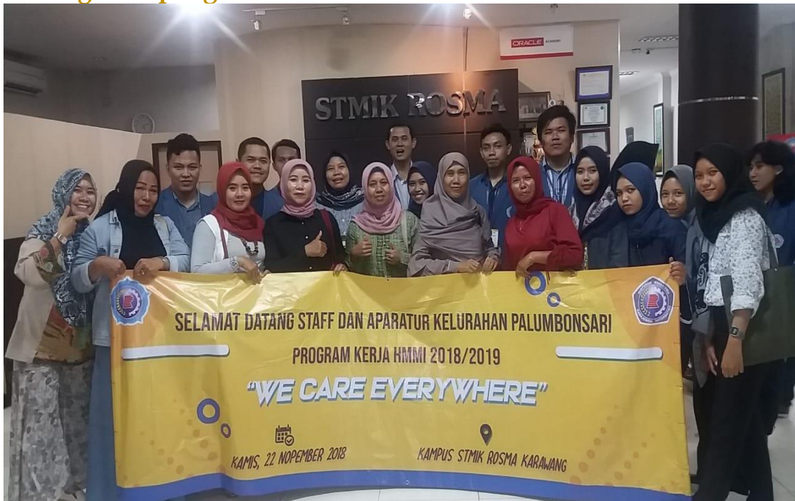
Gambar 3.1. Pelatih dan Peserta Pelatihan (Staf dan Aparatur Kelurahan Palumbonsari Karawang, 2018