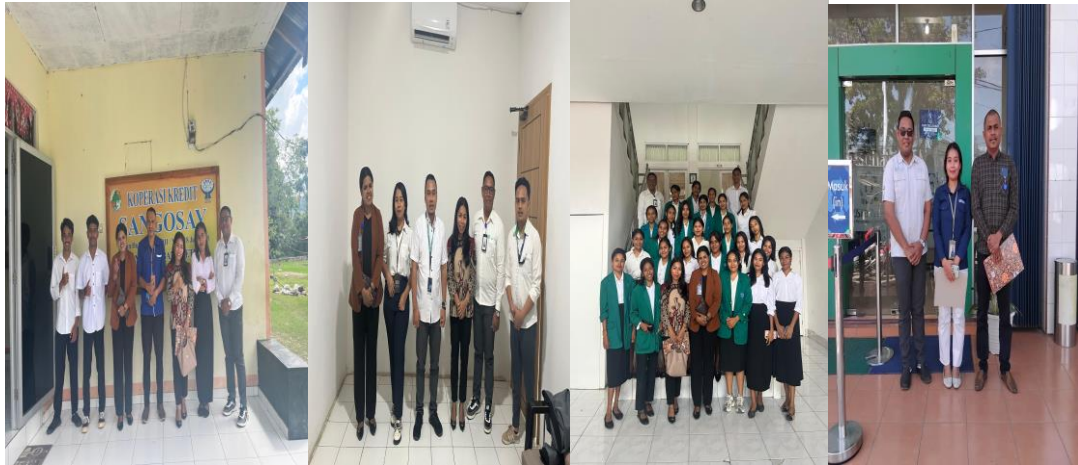
Gambar 3. Pelaksanaan Kegiatan Magang