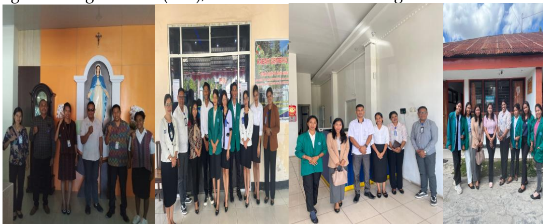
Gambar 3. Survey Kegiatan Magang

Dalam kegiatan magang yang telah dilaksanakan, mahasiswa memperoleh hasil atas apa yang telah dikerjakan baik itu berupa hard skill maupun soft skill yang nantinya akan menjadi bekal mahasiswa ketika memasuki dunia kerja. Pengalaman magang dapat meningkatkan kepercayaan diri dan memperkuat Curriculum Vitae (CV) serta portofolio, bahkan berpotensi membuka pintu peluang kerja atau mendapatkan konversi SKS, serta manfaat seperti: pengalaman kerja nyata, peningkatan skill , jaringan profesional, panduan karier, kepercayaan diri, peluang kerja, penguatan CV dan portofolio, pengakuan angka kredit (SKS), serta sertifikat dan dukungan finansial.