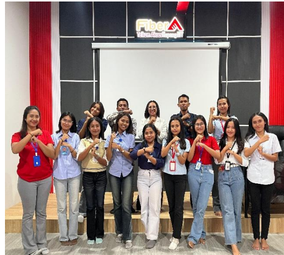
Gambar 7. Foto Bersama Peserta dan Pendamping Lapangan PT. Telkom Indonesia, Tbk Cabang Kupang.