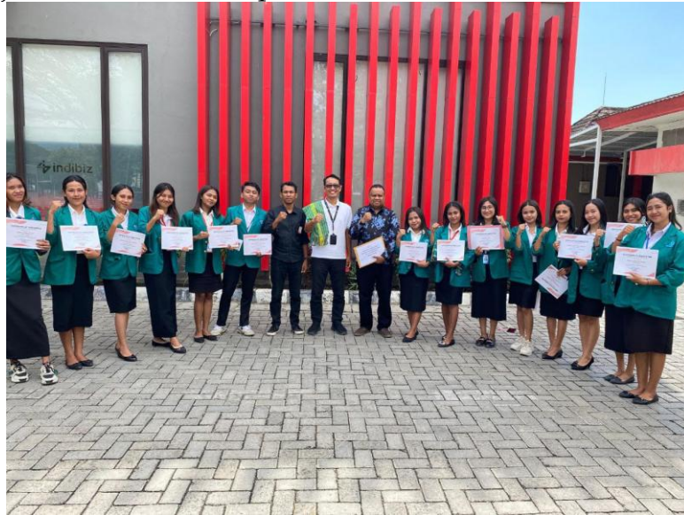
Gambar 6. Penarikan Mahasiswa Magang dari PT. Telkom Indonesia, Tbk

keseluruhan proses magang karena menandai berakhirnya pengalaman praktik kerja dan memulai tahap evaluasi akademik mahasiswa.