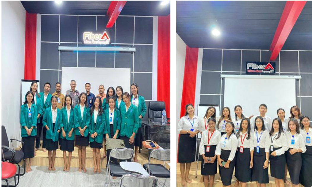
Gambar 2. Pengantaran Mahasiswa Magang oleh Dosen Pendamping

Setelah itu setiap mahasiswa dibimbing oleh mentor dari PT. Telkom Indonesia. Pendampingan ini mencakup arahan tugas disetiap bagian dalam kantor dan penjelasan Jobdes dari setiap mahasiswa disetiap bagian.