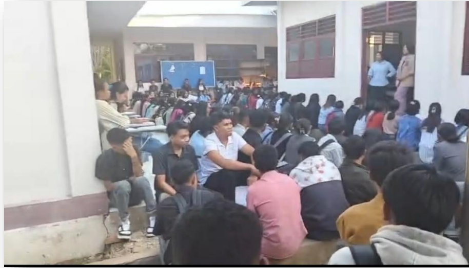
Gambar 1. Sosialisasi, Pembekalan dan Distribusi Mahasiswa Magang Fakultas Ekonomi dan Bisnis, Universitas Timor