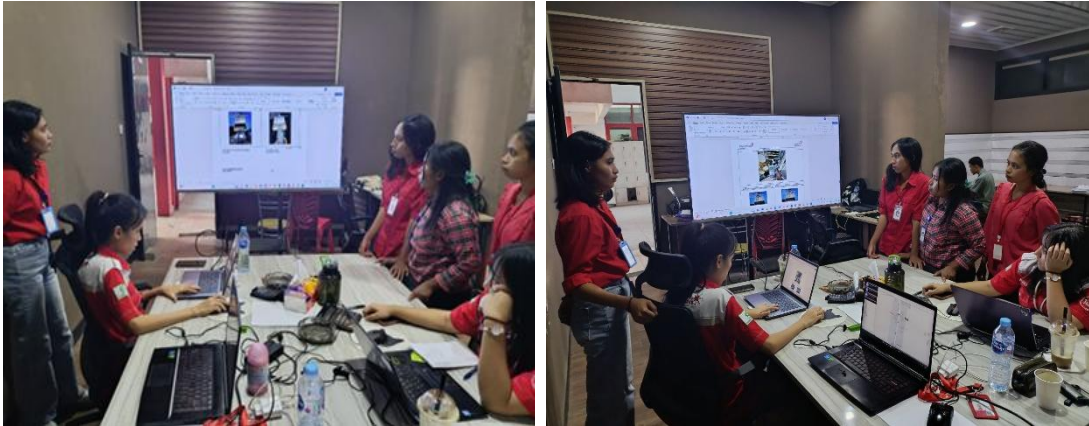
Gambar 4. Pelaksanaan Magang Mahasiswa pada PT. Telkom Indonesia Cabang Kupang

Selain itu mahasiswa juga dilatih keterampilan berkomunikasi, kerjasama tim, problem solving , dan adaptasi terhadap budaya organisasi (Hadiyanto, 2018).