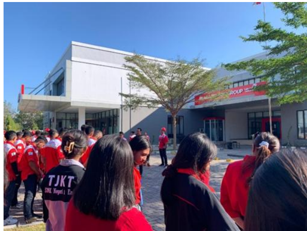
Gambar 3. Mahasiswa Magang dibimbing Oleh PT. Telkom Indonesia Mahasiswa Terlibat dalam kegiatan dalam kegiatan operasional, Proyek dan Studi kasus di pada PT. Telkom Indonesia, Tbk sesuai bidangnya, sehingga mereka dapat menerapkan teori yang diperoleh di kampus (Lestari & Prasetyo, 2022).

Setelah itu setiap mahasiswa dibimbing oleh mentor dari PT. Telkom Indonesia. Pendampingan ini mencakup arahan tugas disetiap bagian dalam kantor dan penjelasan Jobdes dari setiap mahasiswa disetiap bagian.