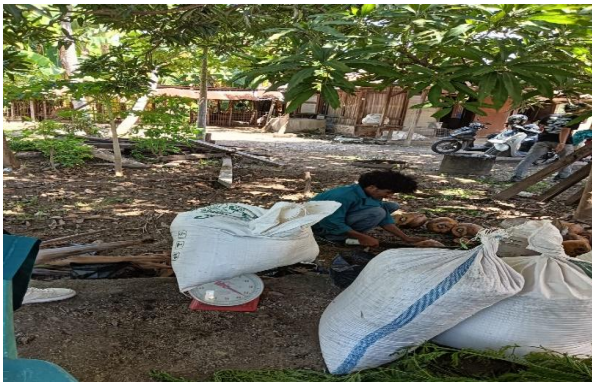
Gambar 2. Kambing yang akan ditimbang

2) Ciri Kambing yang akan ditimbang sebanyak 50 kg