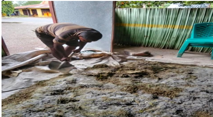
Gambar 8. Adukan adonan