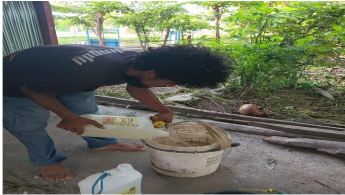
Gambar 7. EM4 (1 liter) dilarutkan kedalam air