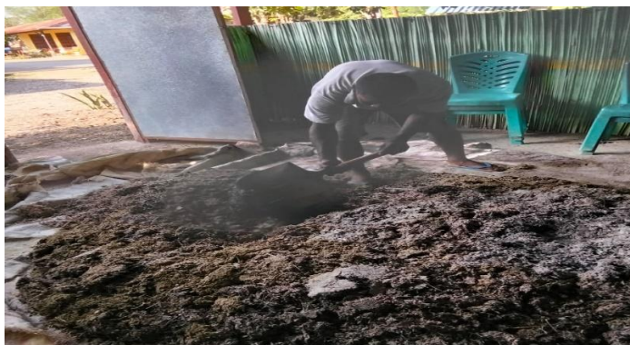
Gambar 9. Pupuk organik padat lamtoro