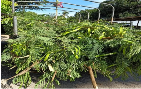
Gambar 1. Lamtoro yang akan di cacah/cincang

1) Lamtoro yang akan di cacah/cincang sebanyak 250 Kg