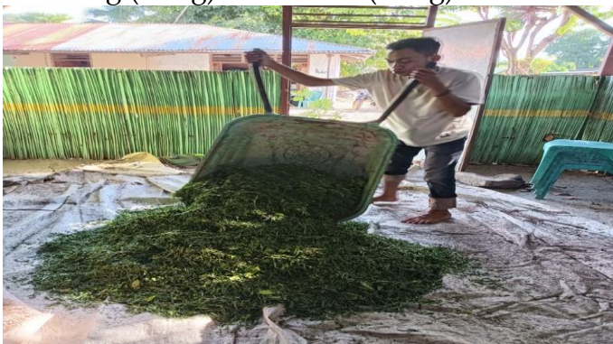
Gambar 6. Pencampuran daun lamtoro