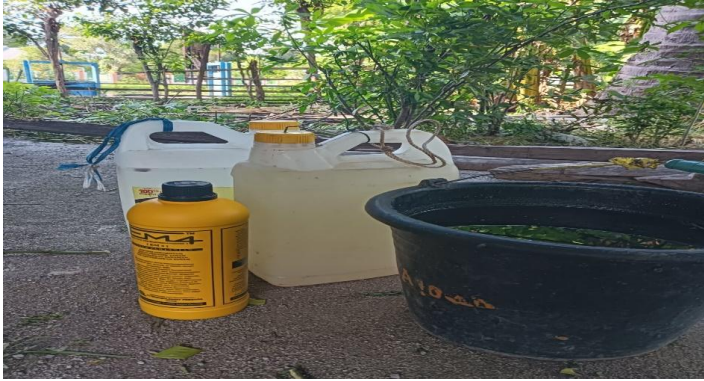
Gambar 4. Air Kelapa