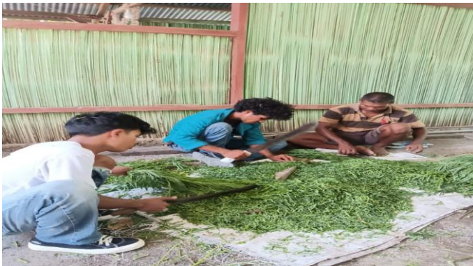
Gambar 5. Pemotongan daun lamtoro