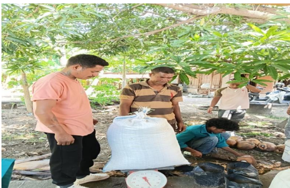
Gambar 3. Dedak yang akan di timbang

3) Dedak yang akan di timbang sebanyak 50 kg